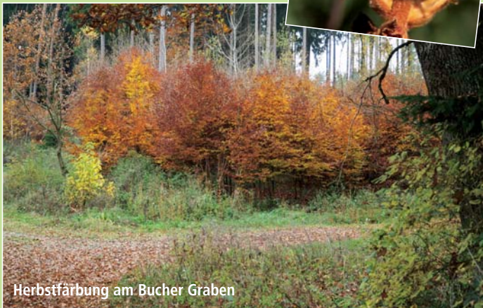
Herbstfärbung am Bucher Graben